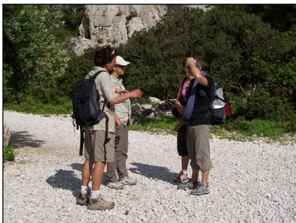
Sensibilisation à En Vau