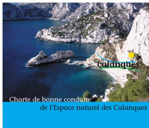
Charte de bonne conduite