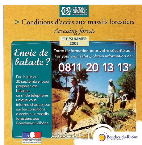
« Envie de ballade ? »