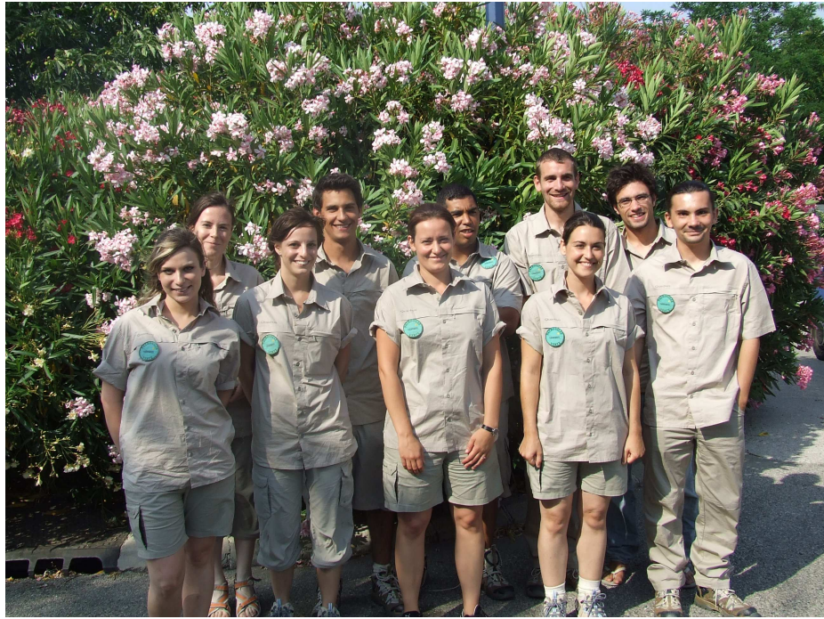
Les « nouvelles recrues » lors de la formation