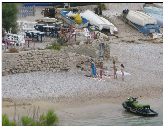
Jet-ski sur la plage de Marseilleveyre

En raison des difficultés liées au plan de balisage, les conflits d'usage déjà existant les années précédentes, se sont amplifiés durant cette saison.