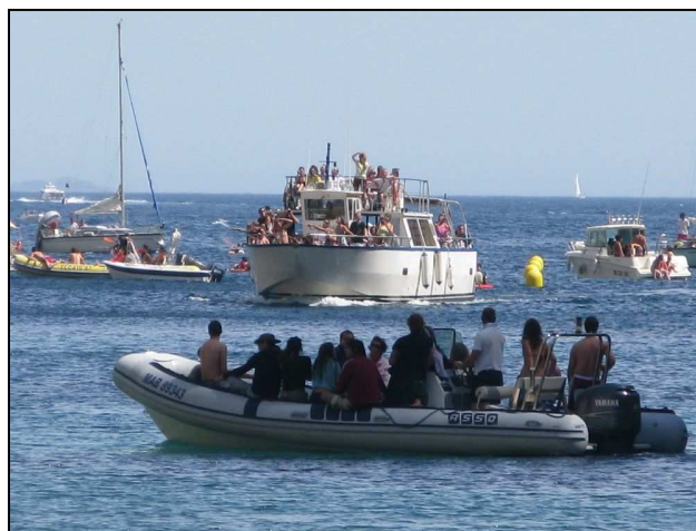
Vues du plan d'eau de la calanque d'En Vau

Le dimanche 28 septembre, dernier week-end de patrouilles, les bouées du plan de balisage des calanques étaient toujours en place.