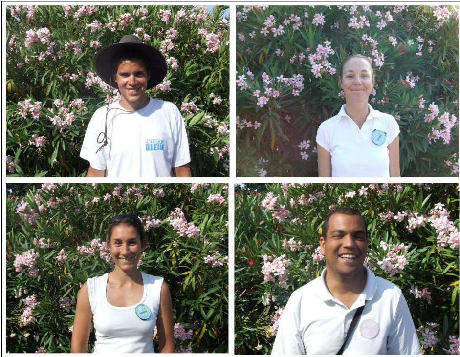
L'équipe 2008 des « Patrouilleurs Bleus » du GIP des Calanques