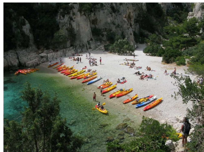
Kayaks à En Vau