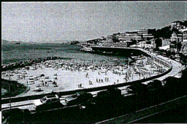
Plage du Prophète